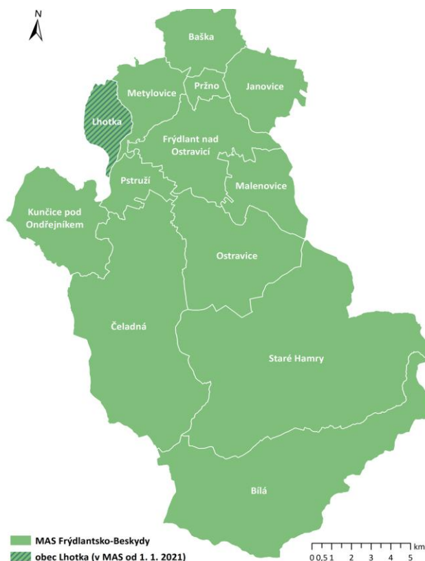
Obrázek 1 Území působnosti MAS Frýdlantsko-Beskydy s vyznačením hranic obcí

Obrázek č. 1 znázorňuje mapu území MAS Frýdlantsko-Beskydy, v níž je vyznačena obec Lhotka, která přistoupila k MAS nově od 1. ledna 2021.